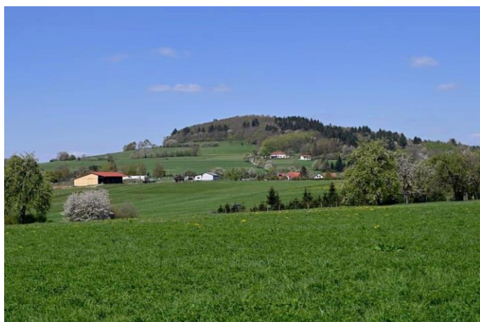
Blick zum Katzenbuckel

Zu unserer ersten Wanderung in 2026 treffen wir uns auf dem Marktplatz in Groß-Gerau und fahren gemeinsam nach Waldkatzenbach im Odenwald. Von hier aus geht es über die Scheuerklinge zum Oberhöllengrund, wo eine Einkehr geplant ist. Gut gestärkt geht's entlang der Eisklinge und des Katzensteigs zum Katzenbuckel, Katzenbuckelturm und Katzenbuckelsee wieder zurück zum Ausgangspunkt.